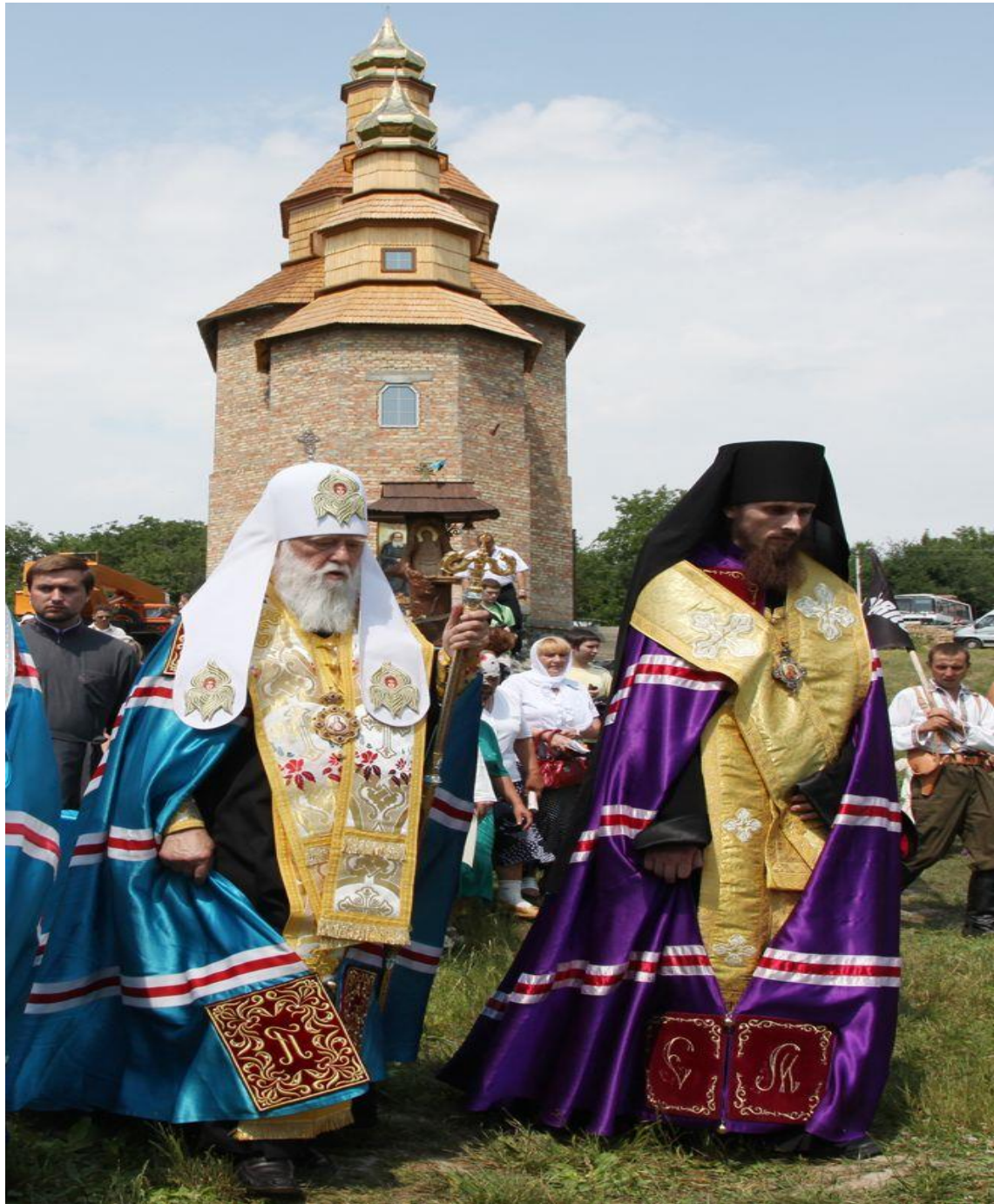
Храм Петра Калнишевського у Холодному Яру освятить особисто Патріарх Філарет// 14 травня 2015, 20:30 Новини Черкас та області // Черкаські новини// Розміщено в Новості – Режим доступу до ресурсу:

Липень 2015 р. Холодний Яр на хуторі Буда Чигиринського району Черкаської області